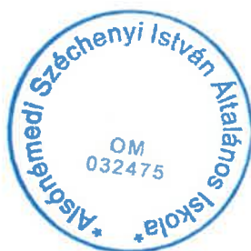
Horváthné Szabó Csilla